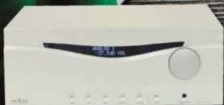
AUDIA FLIGHT FL610