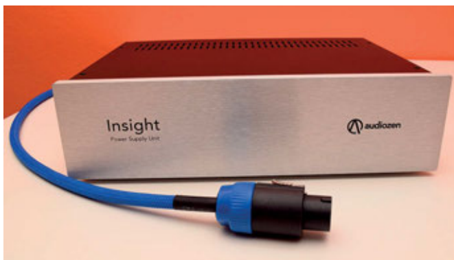
L'alimentatore esterno col relativo connettore.

lì che si gioca la partita. Sì, le gamme alte e medie di elettroniche basate su