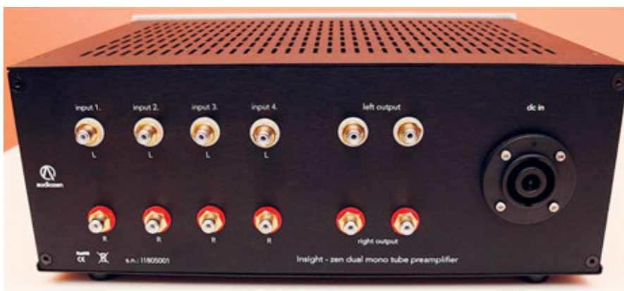
Il pannello posteriore con ingressi linea e uscite per due finali di potenza. Accanto ai connettori RCA la presa per il cavo proveniente dall'alimentazione separata.

search se vogliamo, anche se rispetto ai pre americani si pregia di esclamare a gran voce la sua essenza valvolare.