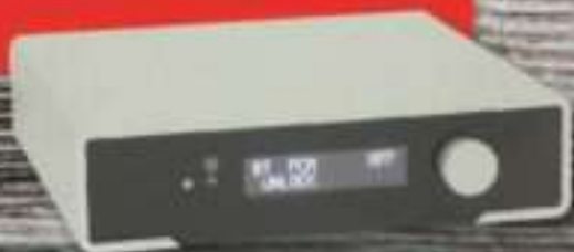
M2TECH YOUNG MKIII