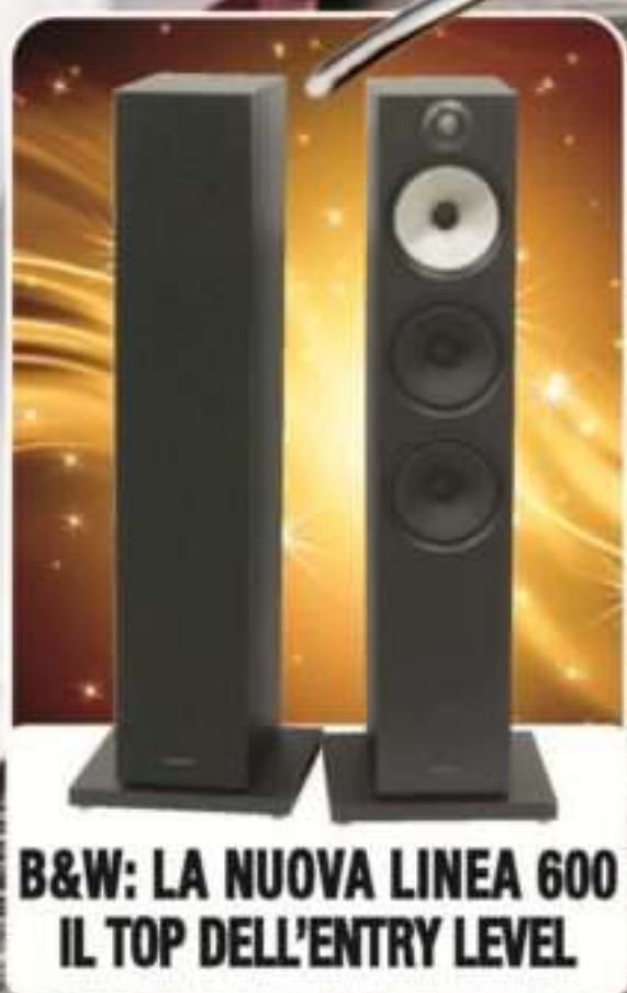
B&W: LA NUOVA LINEA 600 IL TOP DELL'ENTRY LEVEL