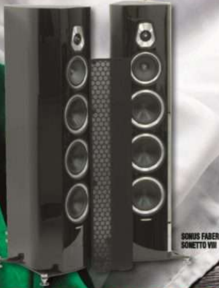
SONUS FABER SONETTO VIII